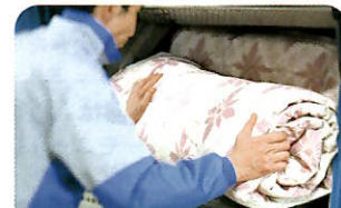
素材ごとに開発した洗剤を使用!