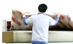
平面乾燥機でしっかり乾燥!