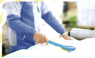
漂白剤は一切使いません!