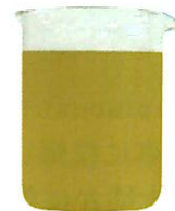
5年間洗わなかったふとんの洗浄汚水 (フレスコ研究所調べ)