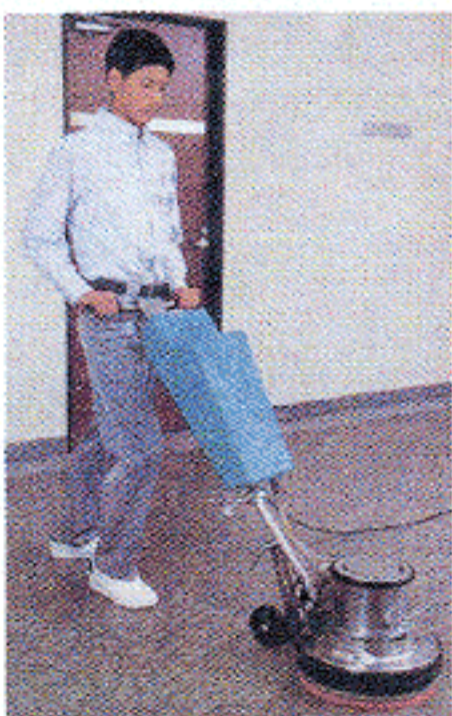
オフィス・店舗の“キレイ”も維持

トイレの場合、尿石や黄ばみの頑固な汚れを除去。便器の裏やタンクの奥すみ、手に触れるノブなども磨き上げます。トイレは家族だけでなく、お客さまも使う場所なのでこまめな掃除が大切です。