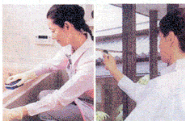
プロならではの資器材と技術で、たまった汚れを落とす

ほかにも庭木の手入れや草刈り、別荘の管理、クロスや障子の張り替え、空気清浄など、ト